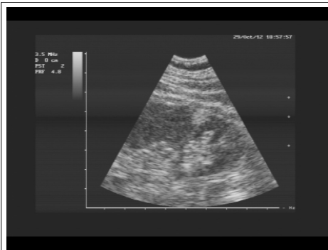
Angiomiolipom lijevog bubrega